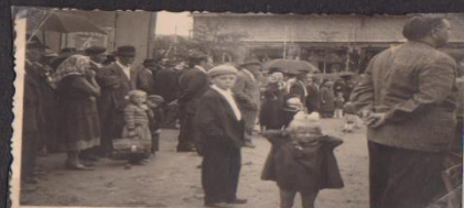
Číslo 6. Pohľad na časť obecnstva pri Oslave otvorenia obce Braváčovo. 21. VII.1957.-Pozri str. 53/I.-kroniky.